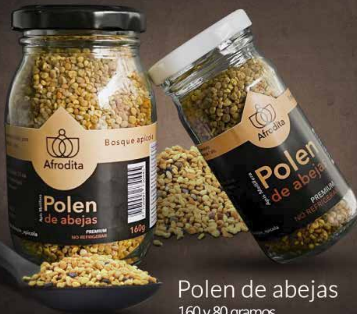
Polen de abejas 160 y 80 gramos